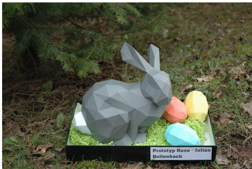
Preisträger im Kreativwettbewerb der Schülervertretung