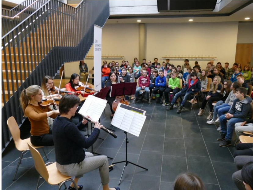
Konzert des SWR-Ensembles